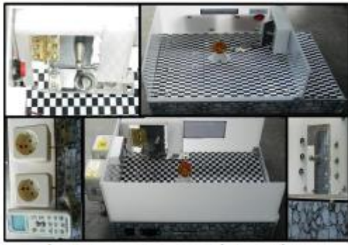
Gambar 5: Prototype Ruang untuk Smart Classroom