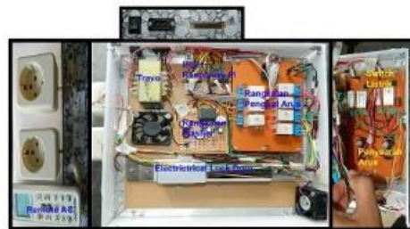
Gambar 4. Perangkat Hardware Sistem Smart Classroom

Pada Gambar 4 terlihat beberapa rangkaian dan alat elektronik yang digunakan sebagai pendukung dalam sistem Smart Classroom. Rangkaian tersebut yaitu: rangkaian input raspberry pi, rangkaian Penguat Catu Daya, rangkaian Switch Arus Listrik, rangkaian Penyearah Catu Daya, dan rangkaian flasher.