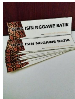
Gambar 9. Implementasi Stiker

Kalender ini digunakan sebagai salah satu media pendukung dan untuk dijadikan sebuah merchandise dan menampilkan juga beberapa busana.