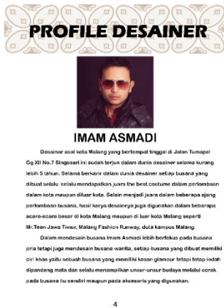
Gambar 6. Halaman Profile Desainer

Pada halaman selanjutnya yaitu halaman profile desainer, pada halaman ini perancang menulis sedikit biodata tentang desainer dan pengalaman dan prestasi desainer selama berkecimpung dalam dunia fashion , selain itu juga terdapat ciri khas dari desainer dalam membuat sebuah busana.