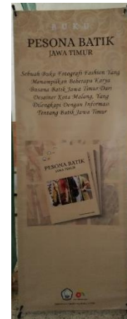
Gambar 32. Contoh Halaman Permainan

Poster digunakan sebagai salah satu media promosi untuk memperkenalkan buku ini kepada masyarakat dengan menampilkan bagian cover buku dan sedikit penjelasan tentang isi buku.