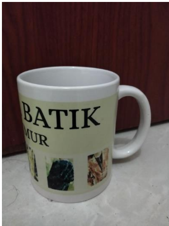
Gambar 10. Implementasi Mug

Stiker ini digunakan sebagai salah satu media pendukung dan untuk dijadikan sebuah merchandise dari produk buku ini.