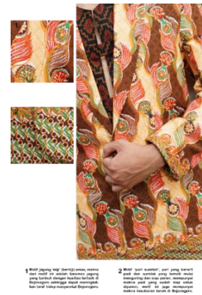
Gambar 4. Halaman Depan Baju dan Halaman Informasi

Pada bagian ini, pembahasan mengenai isi dari buku yaitu contoh halaman pembuka dari salah satu daerah dan halaman pada isi dari setiap daerah.