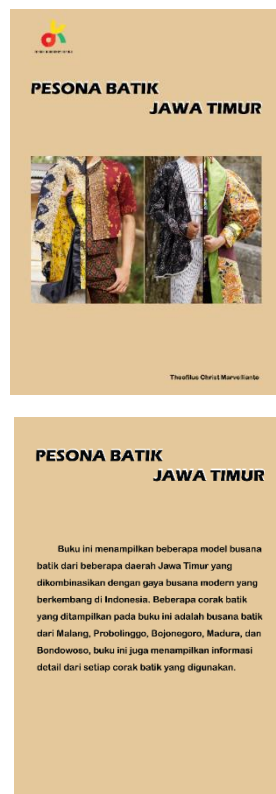
Gambar 3. Cover depan dan belakang

Pada bagian cover depan terdapat judul buku, dan pada cover belakang tertulis judul dan tertulis tentang deskripsi apa yang dibahas dan disebutkan batik dari daerah apa saja yang terdapat dalam buku ini, serta menjelaskan sedikit tentang tujuan buku ini.