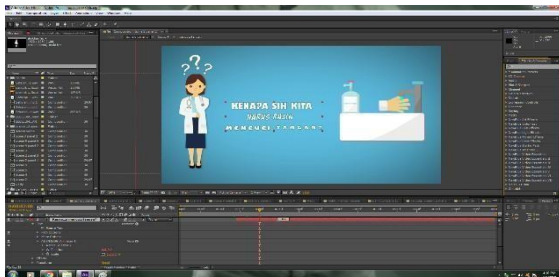
Gambar 6. Animasi Teks

Animasi teks digunakan dalam menampilkan penjelasan informasi yang ingin disampaikan.