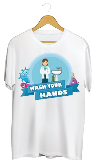
Gambar 11. Kaos

Konsep kaos yang digunakan size chart anak-anak, bahan kaos yang digunakan katun combed 30s bahan ini bersifat tipis dan tidak panas sehingga nyaman digunakan sehingga cocok untuk anak-anak kecil. Visual yang digunakan pada kaos yaitu terdapat background lingkaran dan di belakang terdapat kuman menyampaikan bahwa dengan mencuci tangan kita terhindar dari kuman.