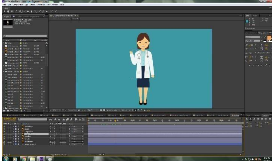
Gambar 4. Rigging Karakter

pemberian tulang menggunakan plug-in DuIK. Langkah pertama untuk me-rigging yaitu memberikan sendi gerak pada bagian tubuh yang akan digerakan kemudian menggunakan puppet pin tool yang ada pada DuIK tools.