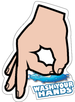
Gambar 12. Gantungan Kunci

Gantungan kunci merupakan salah satu media merchandise. Hal ini dapat dimanfaatkan sebagai media promosi dapat diaplikasikan di tas, kunci rumah, kunci kendaraan material terbuat dari akrilik berukuran 8cm x 5cm.