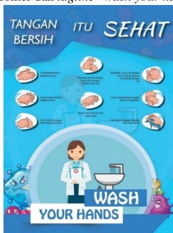
Gambar 10. Poster

Poster berguna sebagai media promosi cetak yang dirancang untuk menjadi salah satu media promosi dan penyampaian pesan yang sesuai serta informatif, poster ini dapat di tempelkan ke mading sekolahsekolah atau dekat wastafel agar dapat mengingatkan untu selalu menjaga kebersihan tangan. Poster ini memiliki format portrait, dengan ukuran A3 (29.7 cm x 42 cm), material yang digunakan artpaper 260gr sehingga memiliki ketebalan dan kaku. Konten yang terdapat pada poster antaran lain judul poster “tangan bersih itu sehat” ilustrasi proses mencuci tangan terdapat karakter dokter dan tagline “ wash your hands ”.