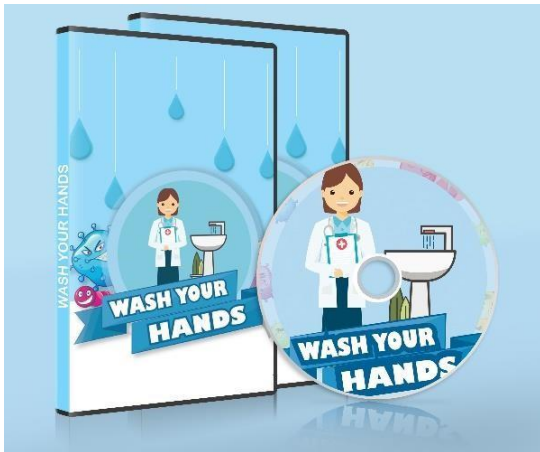
Gambar 9. CD Case

Media ini untuk penyebaran secara fisik , sehingga dapat memudahkan peserta didik melihat secara offline. CD case yang digunakan berukuran 26.5 cm x 16.5 cm bahan terbuat dari material plastik dan terdapat satu keping CD.