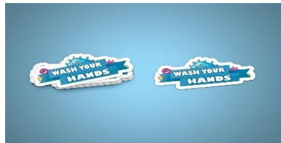
Gambar 11. Stiker

Desain dari stiker menggunakan tagline wash your hands , stiker berguna media promosi tempel untuk memberkan penyampain dalam menjaga kebersihan tangan khususnya bagi anak berkebutuhan khusus (tunarungu), selain mudah untuk diproduksi, fleksibilitas dalam penerapan membuat stiker menjadi keuntngan sendiri dalam bidang penyampian tentang menjaga kesehatan tangan. Ukuran 10cm x 6cm material yang digunakan yaitu kertas Vinly agar terlihat glossy .