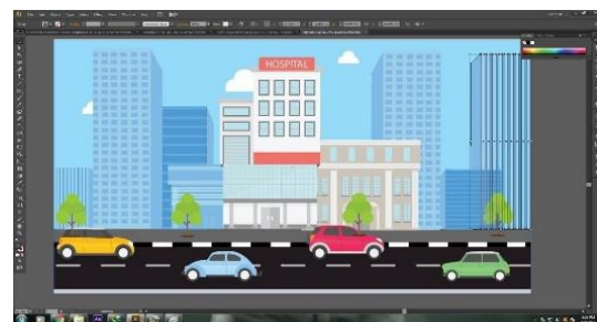
Gambar 3. Desain Background

Latar belakang background yang digunakan pada video Informatif ini terdiri dari suasana depan rumah sakit dan sebagian besar menggunakan solid background . Solid background digunakan sebagai latar adegan penjelasan maupun effect setiap scene dan transisi setiap shot .