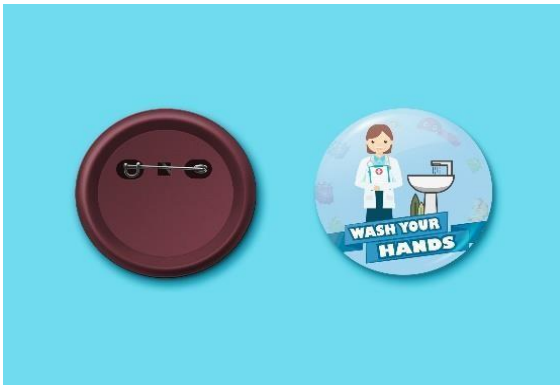
Gambar 13. Pin

Promosi menggunakan media pin ini sangat mudah praktis, awet, dan sangat digemari oleh anak-anak, anak-anak secara tidak langsung juga turut menjadi mediator untuk mendemokan agar menjagakebersihan tangan. Bentuknya kecil tentunya sangat praktis dan dapat digunakan kapan dan dimana saja, konsep visual yang digunakan yaitu menampilkan tempat mencuci tangan, dokter dan tagline , ukuran yang digunakan 5,8cm x 5,8cm berbentuk lingkaran.