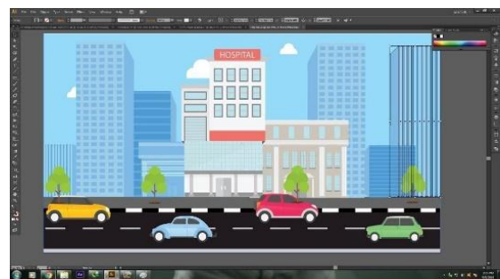
Gambar 7. Animasi Background

Animasi background menggunakan efek transisi seperti menggunakan linear wipe dan radial wipe , selain background yang telah dibuat video ini juga menggunakan solid background dengan tujuan memperjelas informasi atau materi yang disampaikan. Warna yang digunakan pada solid background adalah warna biru muda.