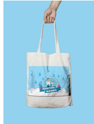
Gambar 13. Tote Bag

Tote bag atau tas kecil digunakan sebaga media promosi karena bentuknya tidak terlalu besar sesuai dengan karakter anak-anak yaitu kecil dan lucu material yang digunakan yaitu dari kain kanfas berukuran 14cm x 21cm.