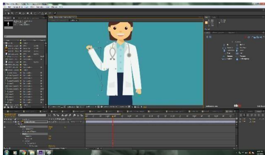
Gambar 5. Animasi Karakter

Karakter yang sudah di- rigging kemudian dianimasikan dengan menekan stopwatch position yang terdapat pada fitur transform di layer Null object yang telah ditentukan. Pada Video Informatif ini, pergerakan karakter hanya sebatas pada gerakan tangan. Karakter tidak dianimasikan secara detail karena video ini fokus pada tulisan.